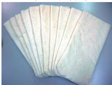
ユーキューフィルター